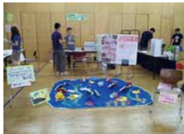
8月 EDU COLLE 出展 @大阪 YWCA 多様な共育の 博覧会