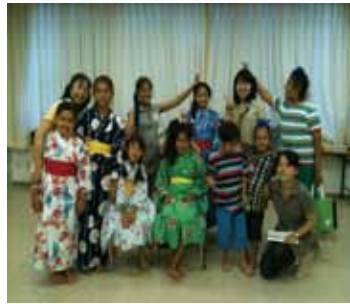
夏まつり @東灘小学校