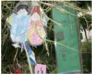
7月 七夕まつり (本庄まち協) @本庄地域福祉 センター前